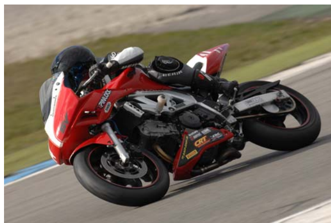
Ilja Caljouw sterk naar de winst.