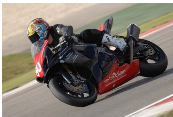
René van Eijk op weg naar de winst.